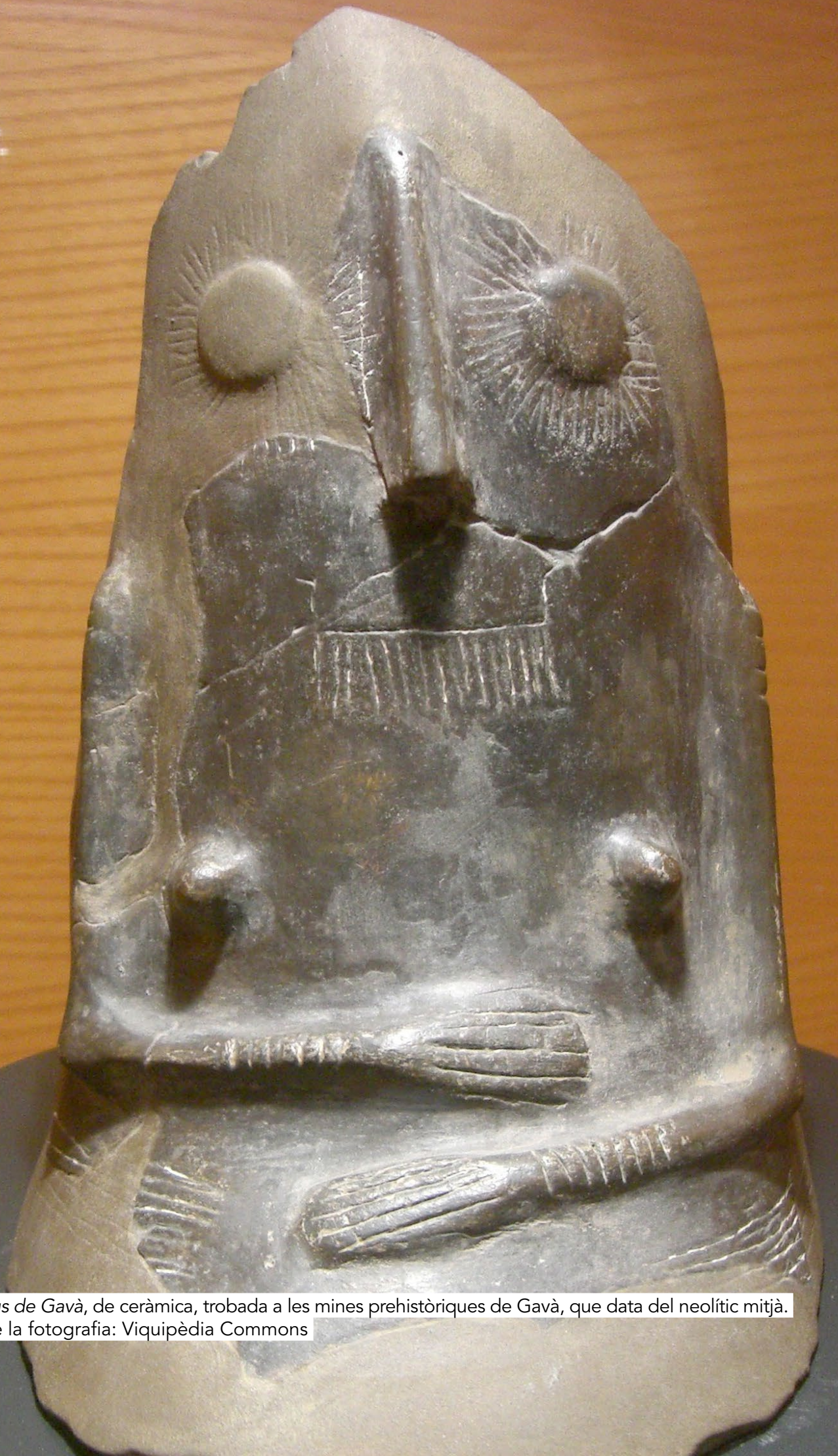
Venus de Gavà, de ceràmica, trobada a les mines prehistòriques de Gavà, que data del neolític mitjà.