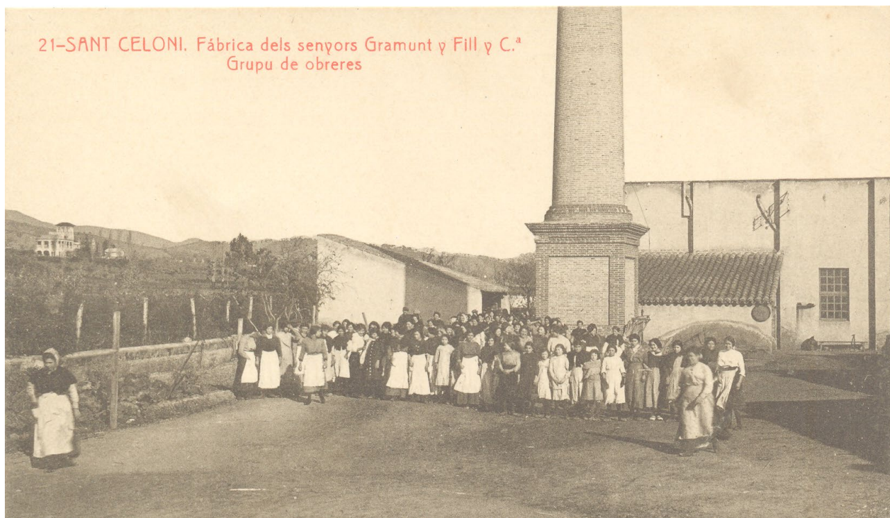
21-SANT CELONI. Fàbrica dels senyors Gramunt y Fill y C. a Grup de obreres

Com és prou conegut, l'activitat laboral de les dones i de la resta de treballadors a les colònies industrials també va ser una peça clau de la industrialització a Catalunya. Concebudes com a pobles privats, el paternalisme industrial va trobar en aquesta fórmula el mecanisme idoni per establir la pau social, el control ideològic i fixar la conducta moral dels treballadors i les treballadores.