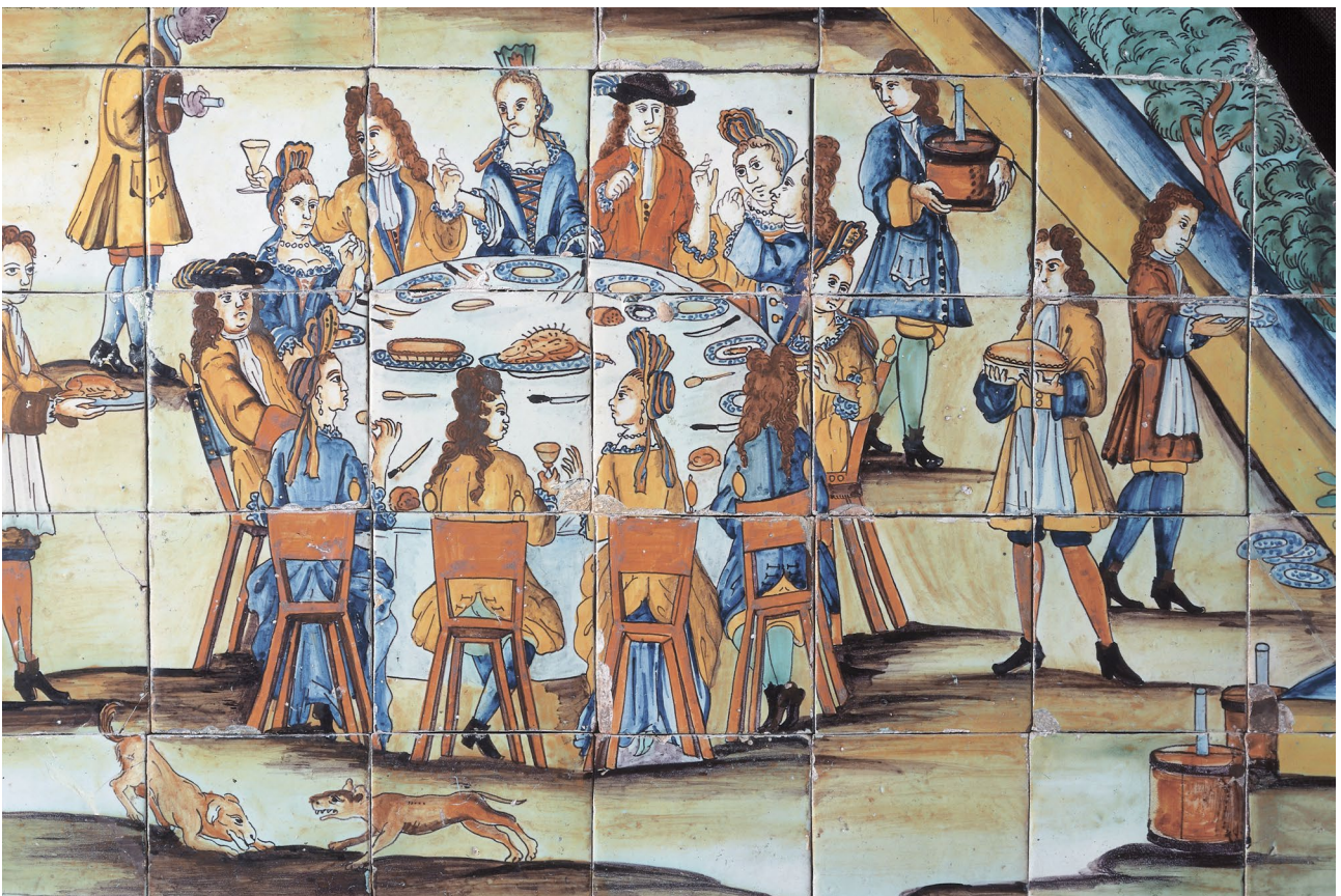
Panell de rajoles de ceràmica on es representa una xocolatada, 1710, procedent d'Allella.

L'influx i la presència pública dels gremis en la vida urbana era enorme atès que participaven en la defensa de la ciutat, eren bàsics en processons i desfilades i prestaven assistència a vídues i orfes dels seus agremiats. Tots ells es trobaven ja aleshores involucrats en els cercles de la protoindústria rural i així podien diversificar la seva producció entre productes artesanals per a un mercat més ric, essencialment urbà, i productes de menys qualitat per a una demanda popular.