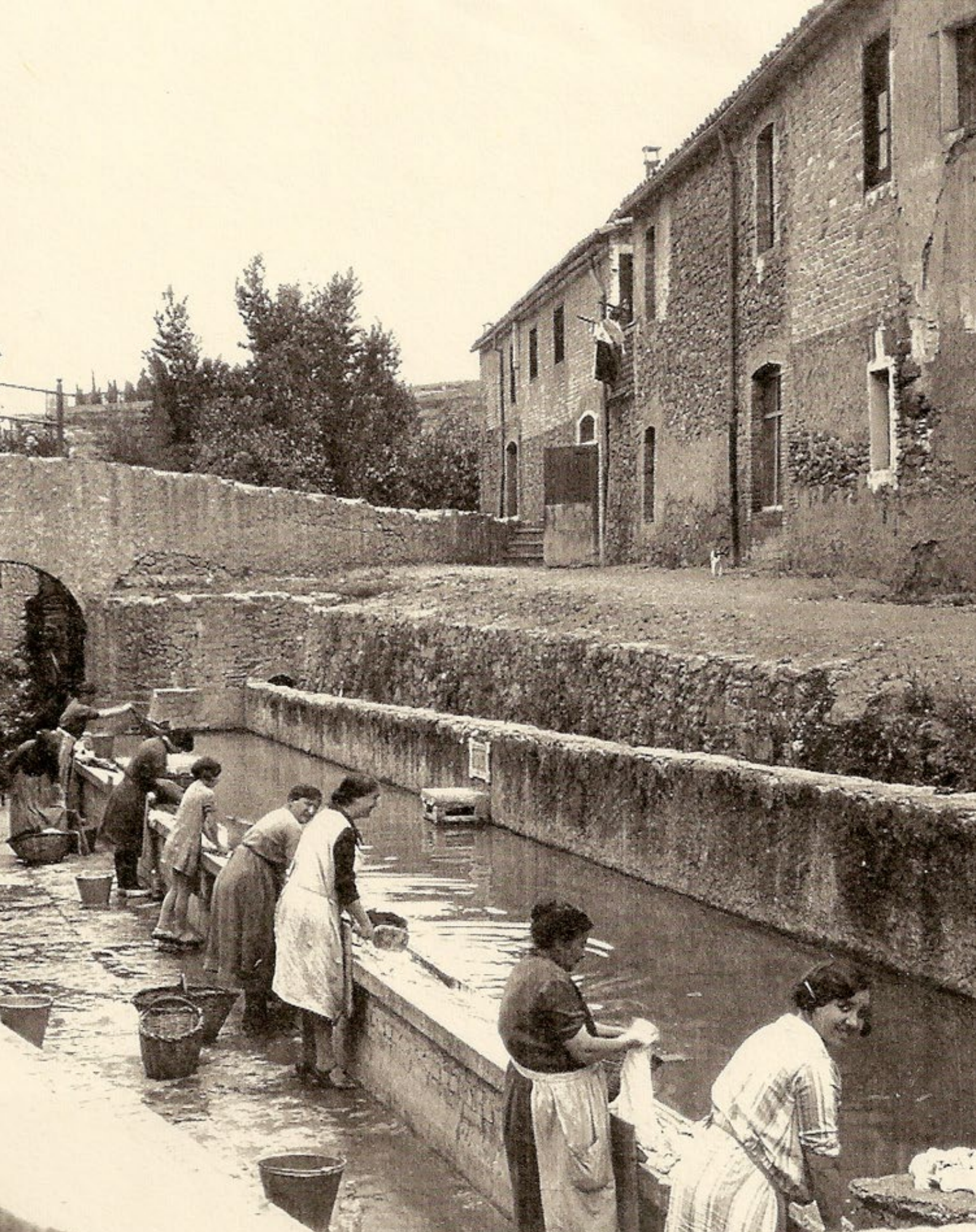
Algunes dones fent la bugada, cadascuna d'elles amb el cistell que utilitzaven per portar la roba, al safareig públic de les Tres Fonts, a Roda de Ter, anys vint.