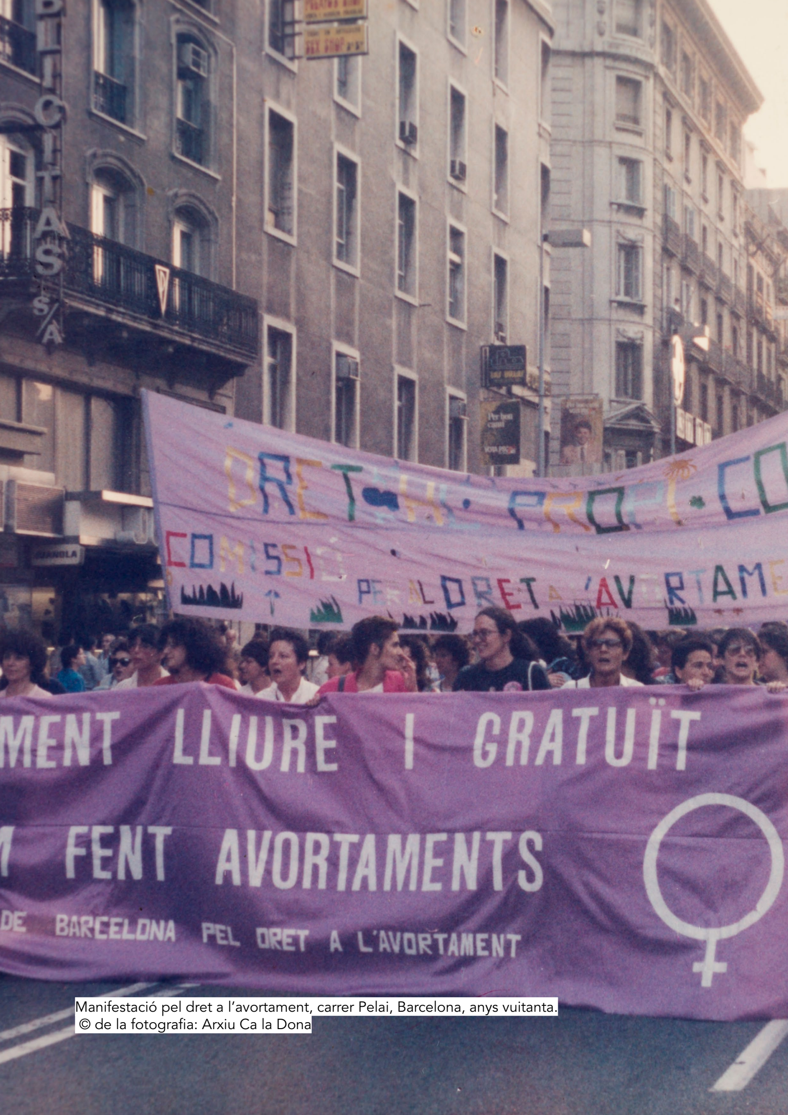
Manifestació pel dret a l'avortament, carrer Pelai, Barcelona, anys vuitanta.