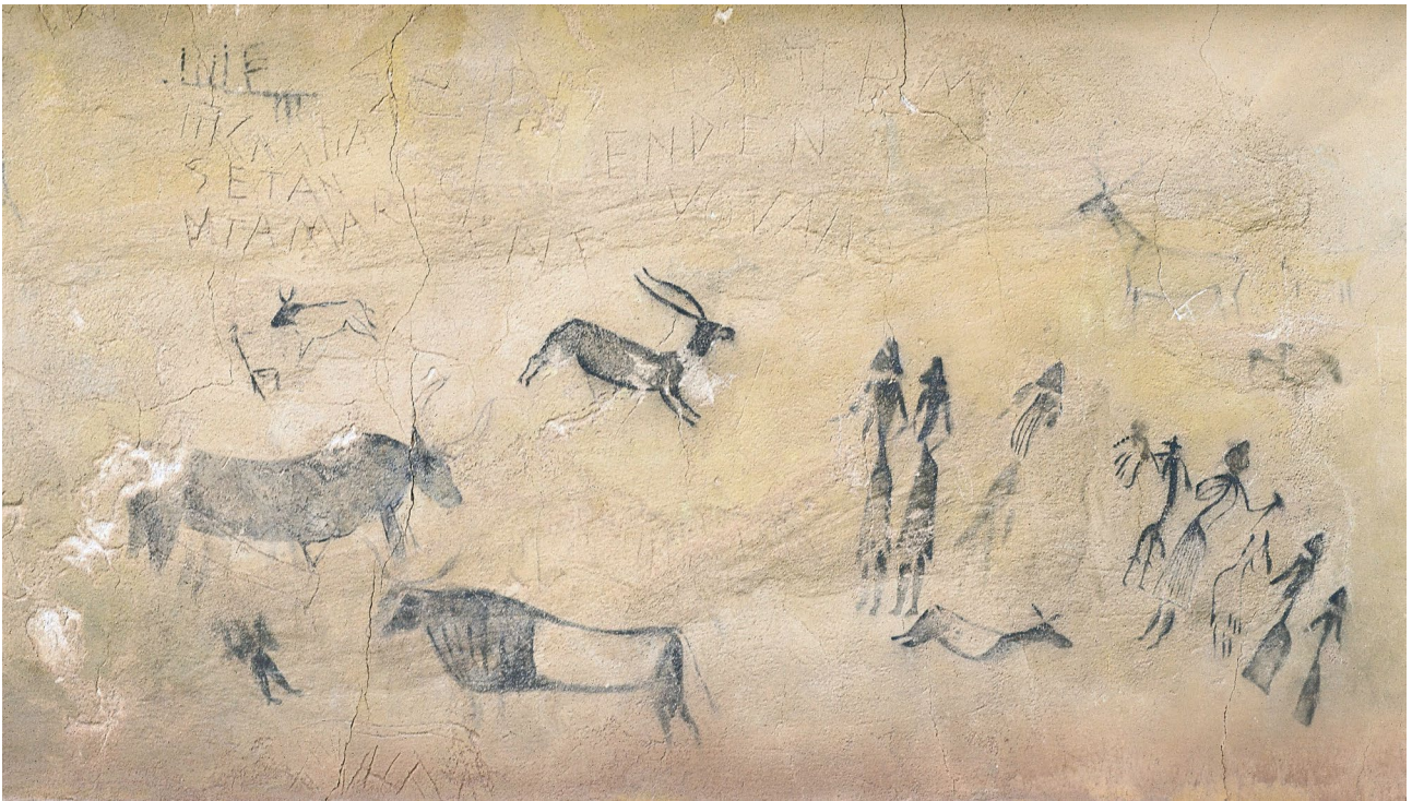
Pintura rupestre de les coves del Cogul, a les Garrigues. S'hi representa una dansa fàl·lica.

La riquesa iconogràfica de les pintures llevantines ha generat múltiples interpretacions del seu significat ritual i ideològic. No obstant això, l'únic que podem assegurar amb la informació disponible és que, a hores d'ara, ens trobem davant societats on la construcció cultural del gènere està clarament establerta i associada, en termes generals, a tasques diferenciades dins de la comunitat. Tot i que tradicionalment aquestes pintures s'han llegit en termes de dominància de la ideologia caçadora-guerrera i de rituals xamànics liderats per homes, 2 no hi ha indicadors que permetin vincular aquestes representacions a desigualtats de caràcter sociosimbòlic.