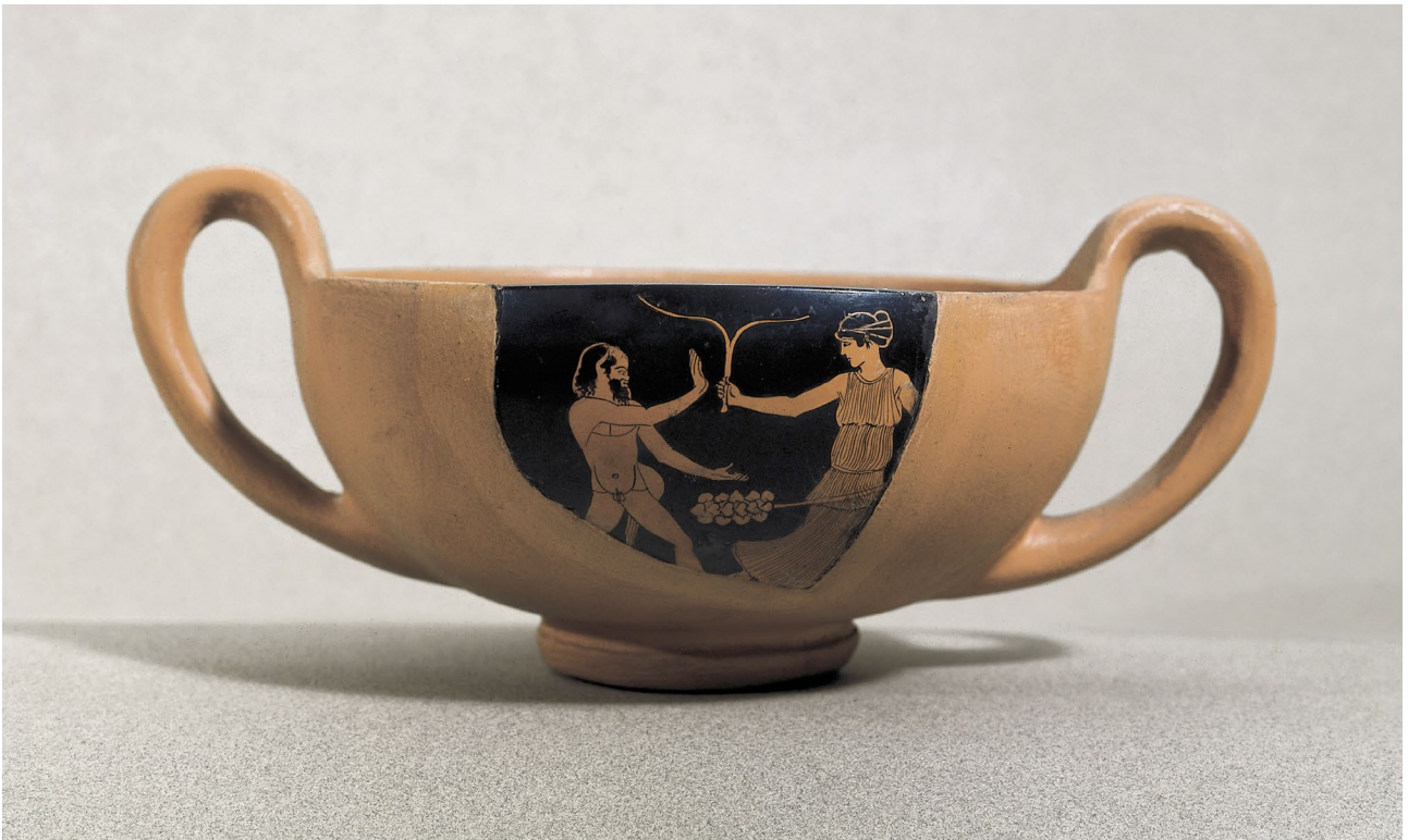
Vas de ceràmica amb figures roges del segle V aC procedent d'Empúries, l'Escala.

Al Barri Hel·lenístic s'han relacionat dos forns de ceràmica que van funcionar al llarg del segle III aC que es van trobar als blocs IV i VI, en dues cases separades per uns vint metres. Tant en el cas dels tallers ceràmics com en el dels metal·lúrgics trobem estructures i espais dedicats a la producció artesanal estretament associats amb àrees domèstiques, on s'han localitzat llars de foc, molins, peses de teler i zones d'emmagatzematge. En l'estat actual de les recerques no és possible proposar fins a quin punt la mateixa proporció detectada al Barri Hel·lenístic, és a dir un 33% de les cases, es donaria en altres parts de Roses. Però cal assenyalar que en altres assentaments grecs i romans s'han documentat situacions similars d'aparició d'àrees de producció artesanal lligades a contextos domèstics.