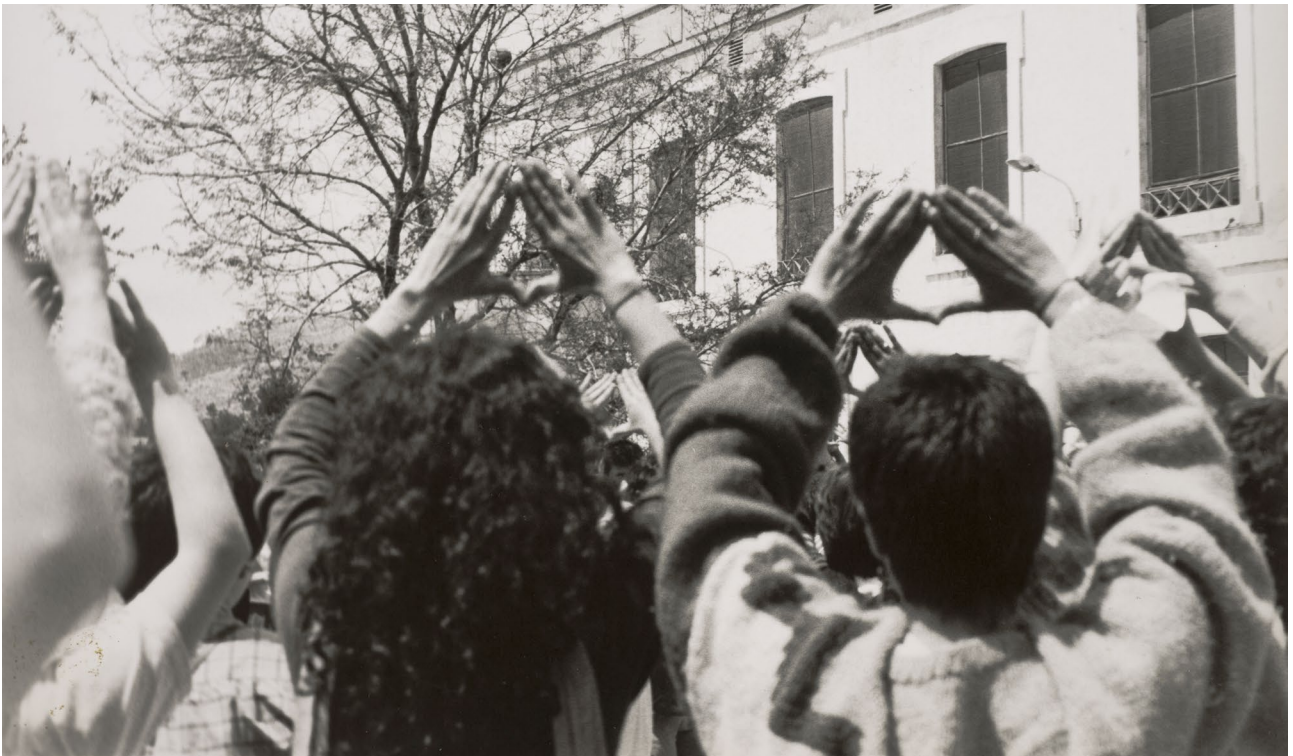
Acampada de Dones per la Pau a Tortosa, maig de 1985.

Precisament, les Jornades obriren el debat públic sobre la sexualitat i els drets reproductius com a punts bàsics de la cultura política democràtica. Defensant la llibertat sexual femenina, la planificació familiar, el dret als anticonceptius i a l'avortament identificaren en públic els drets de les dones en aquest terreny tabú. D'aquesta manera consolidaren un dels postulats bàsics del nou feminisme de convertir allò que és personal en política. A partir d'aquell moment, en un llenguatge polític, el moviment de dones va avançar en la definició dels drets reproductius com a inherents als drets ciutadans.