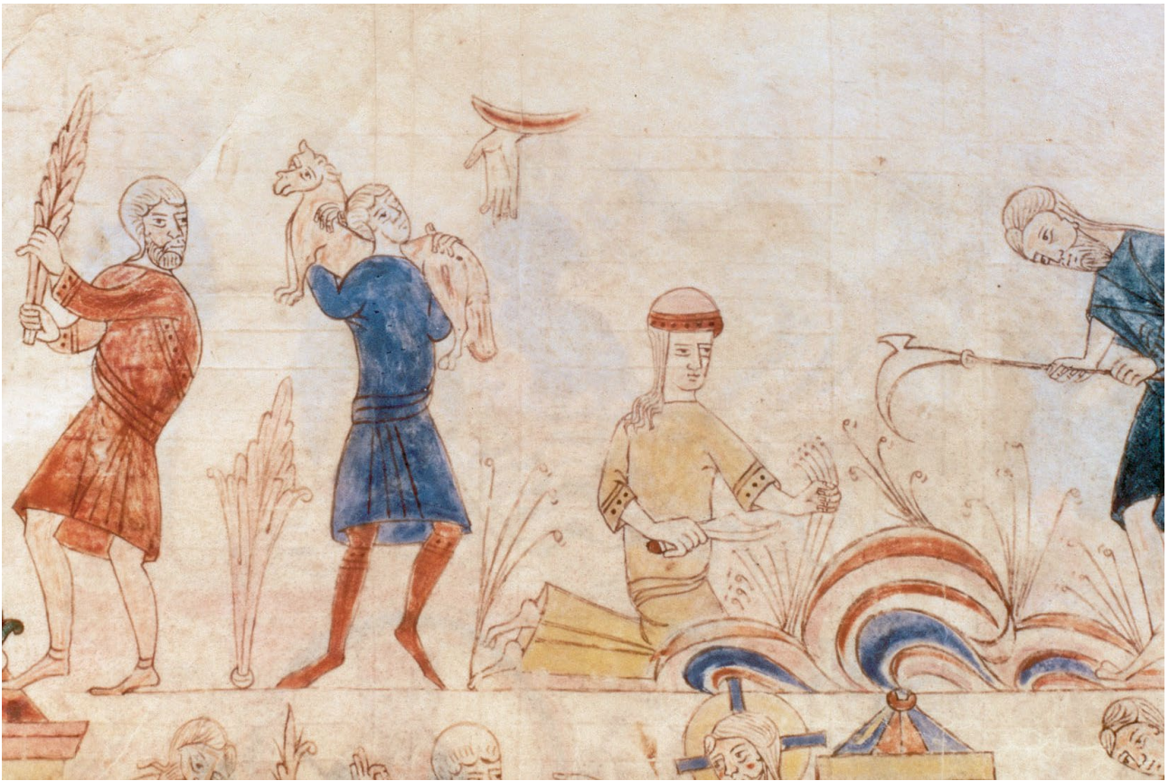
Detall de la Bíblia de Ripoll , segle XI. Adam segant amb una dalla i, al seu costat, Eva fent-ho amb una falç.

Hi hagué moments de fam, famílies que empenyoraven les terres a canvi de cereal per poder menjar i plantar (Benito, 1999, p. 189-203), repobladors que van haver d'abandonar les aprisions i tornar-se'n. El bisbe Oliba de Vic, l'any 1023, deia: «S'ha presentat l'eixorquia de la fam i la misèria de la sequera en aquesta nostra regió; per això molts dels conreadors se n'anaren a Tolosa i per aquest estat de necessitat una gran part de la nostra terra ha arribat a la devastació de l'erm» ( Catalunya romànica 9, p. 506). De tota manera, globalment es produïen excedents i aparegueren els primers mercats d'intercanvi en espècies o en diner musulmà a partir de 1010. 6