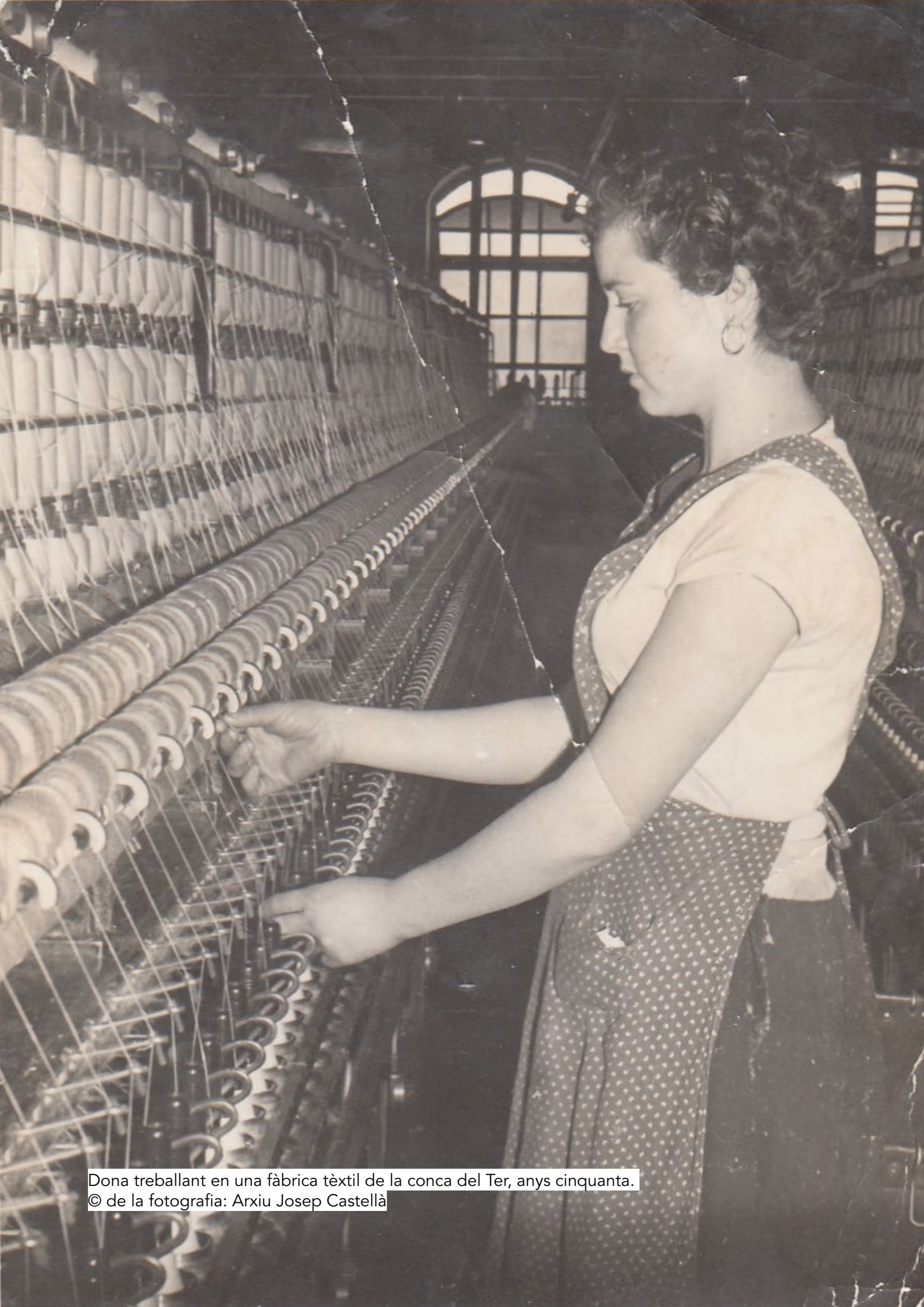
Dona treballant en una fàbrica tèxtil de la conca del Ter, anys cinquanta.