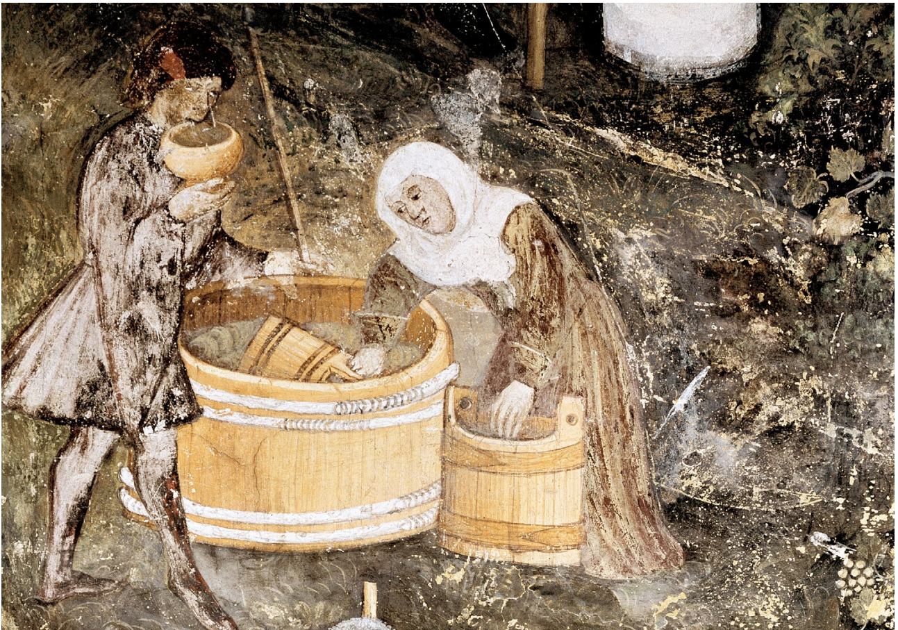
Cicle dels mesos, 1391-1407. El mes de setembre, detall de la preparació del vi. Castell del Buonconsiglio, a la ciutat de Trento.