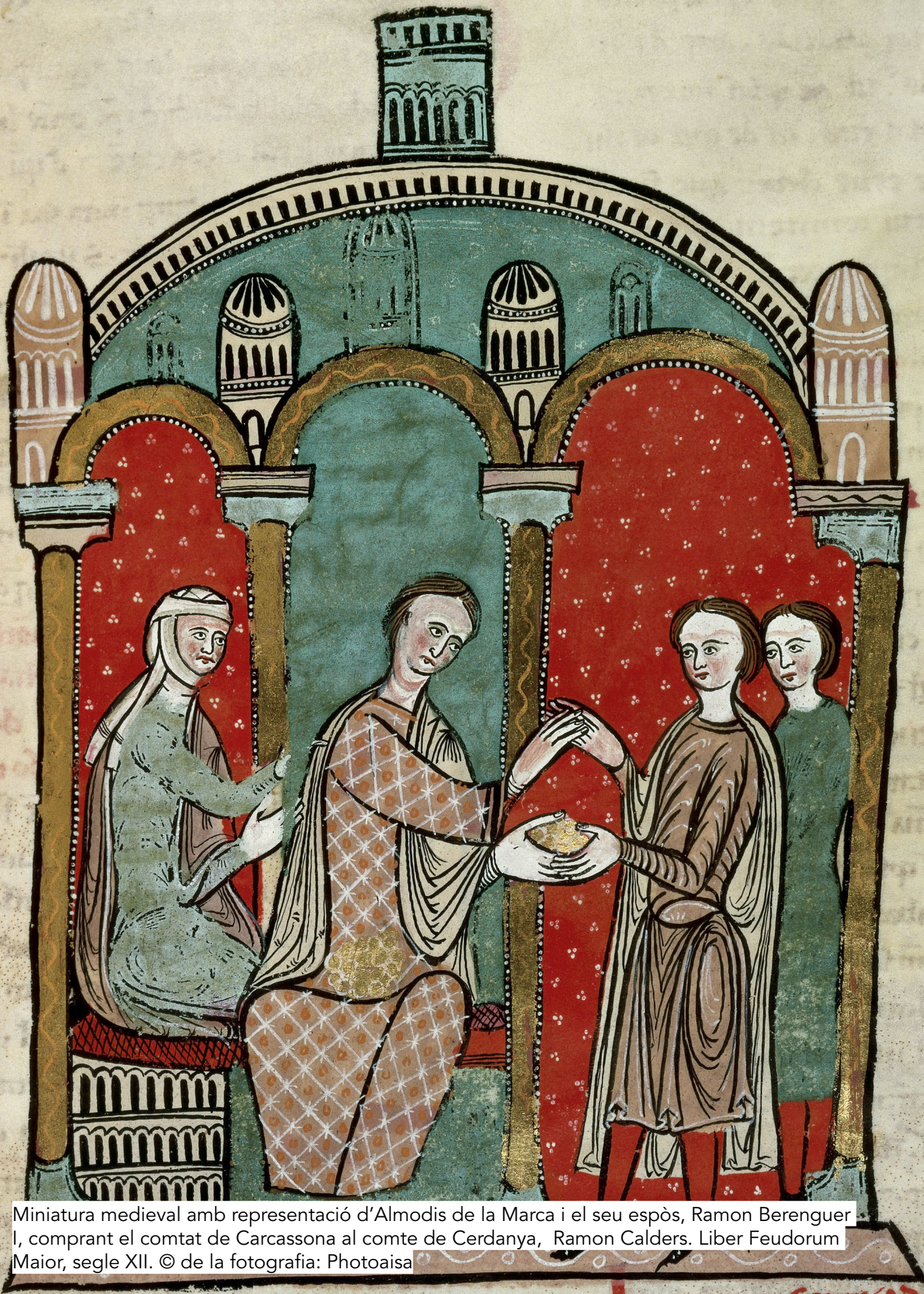
Miniatura medieval amb representació d'Almodis de la Marca i el seu espòs, Ramon Berenguer I, comprant el comtat de Carcassona al comte de Cerdanya, Ramon Calders. Liber Feudorum Maior, segle XII.

Incipunt Carte adquis quas uenabilis. R. beren ... ..