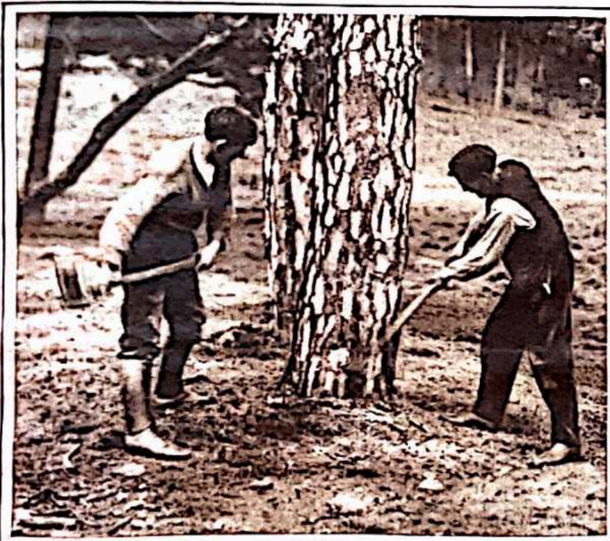
La corta se comienza con golpes continuos de hacha esgrimida por dos hombres.