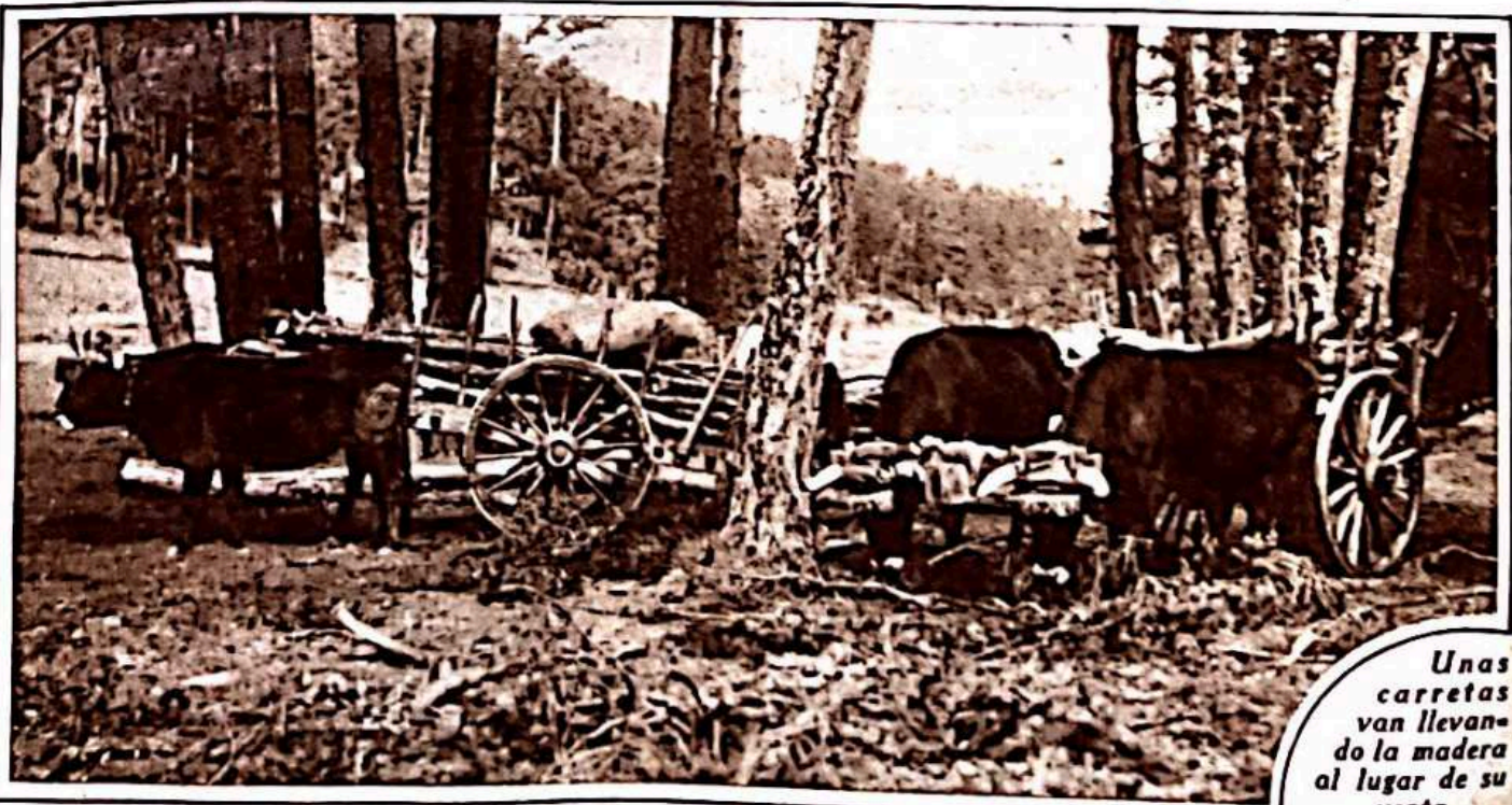
Unas carretas van llevando la madera al lugar de su venta.

Después, todo es cosa de los favorecidos. Por lo regular, salen al sitio señalado en cuadrilla y se ayudan unos a otros en “el desmoche”, que no es precisamente desmoche, sino corta de raíz. Luego cada uno hace lo que más le conviene. Vende la madera en el mismo pinar, o la lleva al lugar de la venta en unas carretas estilizadas, tiradas por bueyes, que dan la justa estampa bucólica que reclama el paisaje. O se reúnen para poner en marcha una “serrería”, y allí, siem-