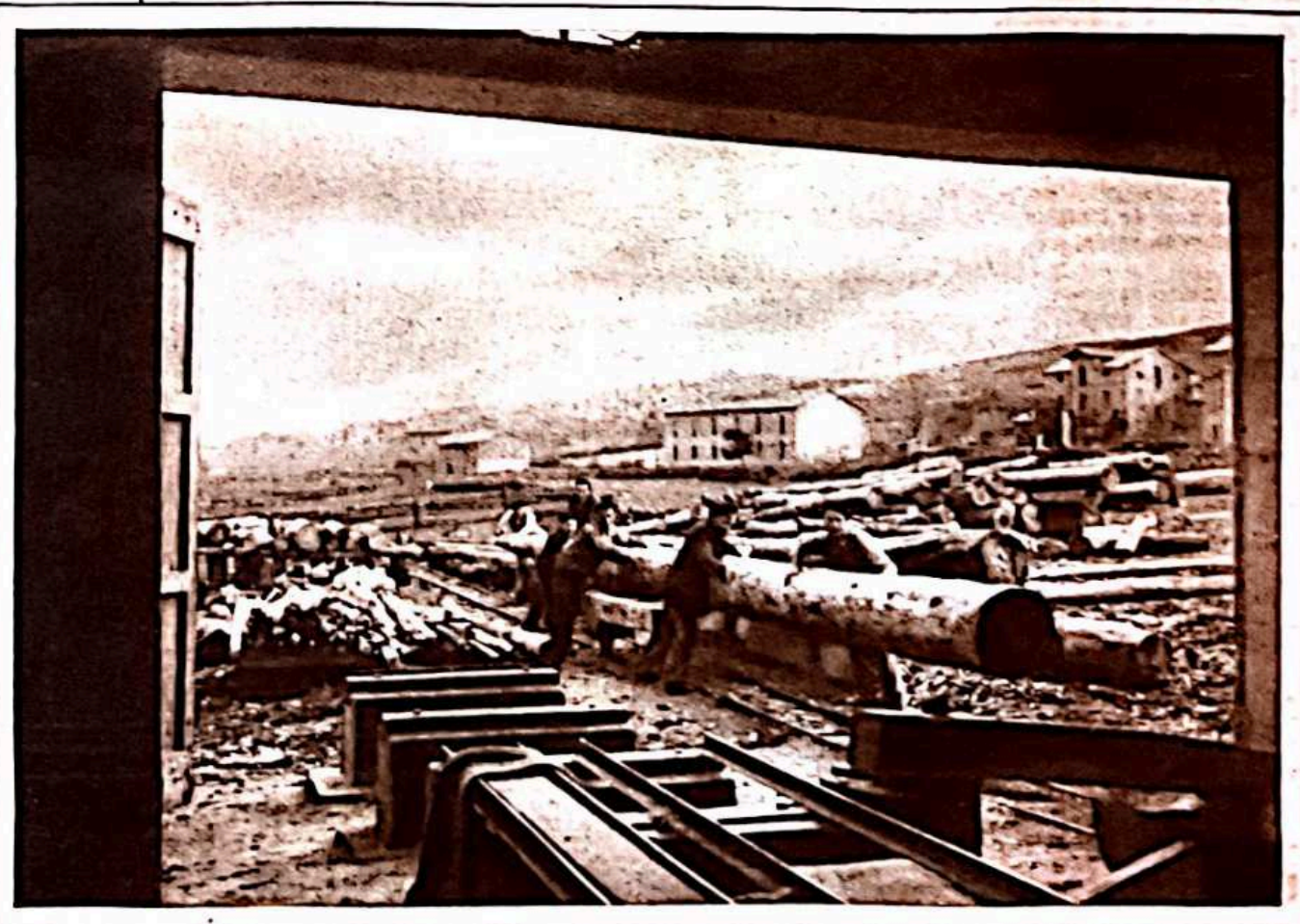
En las "serrerías" se trabaja en común, como en todos los sitios de estos pueblos pinariegos.