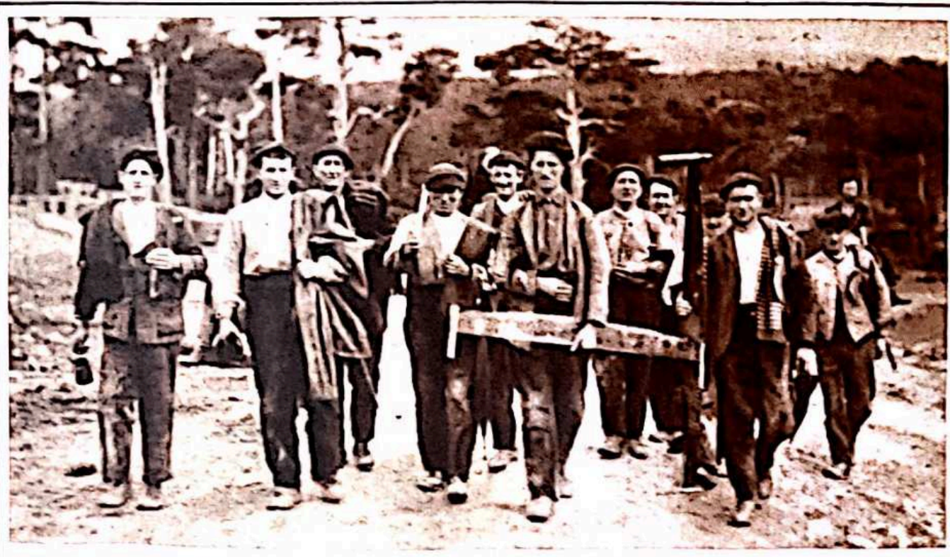
Los hombres marchan en cuadrilla a cortar sus "suertes".

Los hombres trabajan llenos del contento de quien corta de lo suyo, que es lo de todos. ¿Se oyen cantares? ¿Se sueltan dicharachos? ¿Se dicen cuentos misteriosos, narraciones de bosque, que son, cuan-